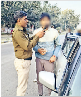
रेवाड़ी। वाहन चालकों में शराब की मात्रा चेक करती पुलिस।

जिला पुलिस की ओर से गत 15 दिसंबर से 21 दिसंबर तक जिले में ट्रिंक एंड ड्राइव, वाहनों में तेज डीजे-प्रेसर हॉर्न बजाने, लोन चेंज नियमों की अवहेलना करने व बुलेट पटाखा छोड़कर हवाबाजी करने वालों के खिलाफ स्पेशल अभियान चलाया गया। अभियान के दौरान नियमों का उल्लंघन करने वालों पर कड़ी और प्रभावी कार्रवाई की गई। पुलिस ने गत सप्ताह के दौरान ट्रिंक एंड ड्राइव अभियान के तहत शराब पीकर वाहन चलाने वालों के