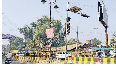
रेवाड़ी। अंबेडकर चौक, बावल चौक तथा अग्रसेन चौक पर बंद पड़ी ट्रैफिक लाइटें।