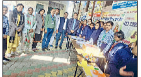
रेवाड़ी। स्कूल में लगी प्रदर्शनी का अवलोकन करते प्राचार्य व स्टाफ।