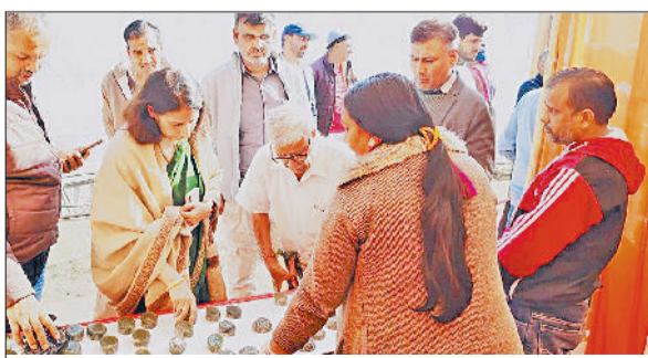
नारनौल। सेमिनार में प्रदर्शनी का अवलोकन करते अधिकारी।

कृषि तकनीकों का सजीव प्रदर्शन किया। साथ ही किसानों की शंकाओं को दूर किया। प्रदर्शनी में प्रगतिशील किसानों और समूहों ने पारंपरिक खेती के घेरे से बाहर निकलकर स्मार्ट फार्मिंग की ओर आगे बढ़ाने की उत्सुकता दिखाई। कार्यक्रम में उपस्थित किसानों ने सरकार की बागवानी समर्थक नीतियों की सराहना की। उन्होंने कहा कि इससे