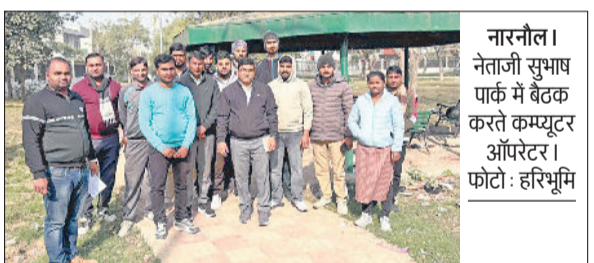
नारनौल। नेताजी सुभाष पार्क में बैठक करते कम्प्यूटर ऑपरेटर।