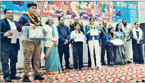
रेवाड़ी। वार्षिक समारोह में मेधावी बच्चों को सम्मानित करते सभा के सदस्य तथा सांस्कृतिक प्रस्तुति देते हुए महिलाएं।

मौसम में घने कोहरे के दौरान वाहन सीमित गति में, निर्धारित लेन में रहकर और यातायात नियमों का पालन करते हुए वाहन चलाएं, ताकि किसी भी प्रकार की दुर्घटना से बचा