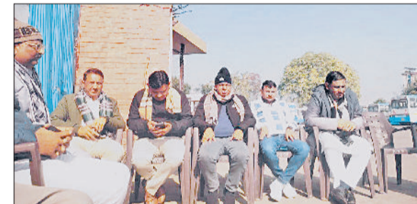
नारनौल। मीटिंग करते रोडवेज कर्मचारी नेता।