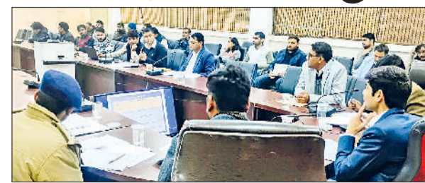
रेवाड़ी। अधिकारियों को दिशा-निर्देश देते हुए डीसी मीणा।

डीसी अभिषेक मीणा ने अधिकारियों को सर्वे में घने कोहरे को देखते हुए जिले में नई व मरम्मत की गई सभी सड़कों पर साइन बोर्ड, सफेद पट्टी व रिफ्लेक्टर लगाने के निर्देश दिए हैं। डीसी मीणा सोमवार को लघु सचिवालय सभागार में सड़क सुरक्षा समिति की जिला स्तरीय समीक्षा बैठक में अधिकारियों को आवश्यक दिशा निर्देश दे रहे थे। उन्होंने कहा कि सभी सड़कों पर पूर्ण रूप से मार्किंग हो। ऐसे में संबंधित